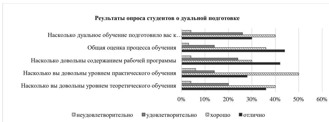
Рис. 2. Результаты опроса студентов, проходящих дуальную подготовку / Fig. 2. The results of the survey of students undergoing dual training

В опросе приняли участие студенты колледжа, проходящие дуальную подготовку. Результаты опроса представлены на рисунке 2.