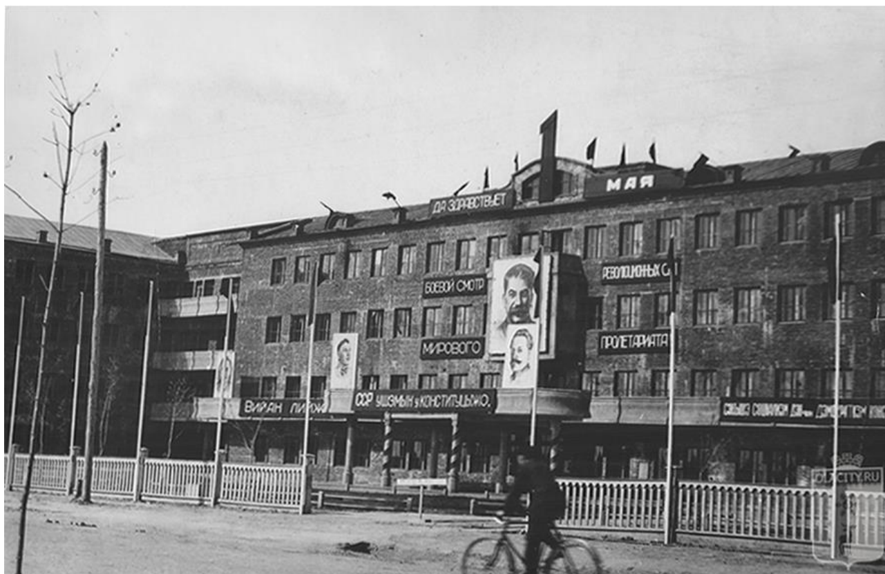
Рис. 4. Центральный вход в здание Дома Советов. 1930-е гг. 1 / Fig. 4. The central entrance to the House of Soviets. 1930s. 1

Дом Советов функционировал, несмотря на имевшиеся недоработки 2 . 26 июля 1938 года в зале заседаний Дома Советов Марийской АССР прошло торжественное открытие Первой сессии Верховного Совета Марийской АССР первого созыва 3 . В этот же период наряду с торжественными мероприятиями проводились строительные работы. Объем переходящих работ на 1938 год оценивался в сумме 426,61 тысячи рублей. Велись работы по штукатурке фасада, проводке телефонной линии 4 . Постановление Совета народных комиссаров Марийской АССР о ликвидации конторы по строительству здания Дома Советов было принято 23 декабря 1938 года в связи с окончанием строительных работ и нерентабельностью содержания аппарата управления. С 1 января 1939 года все имущественные ценно-