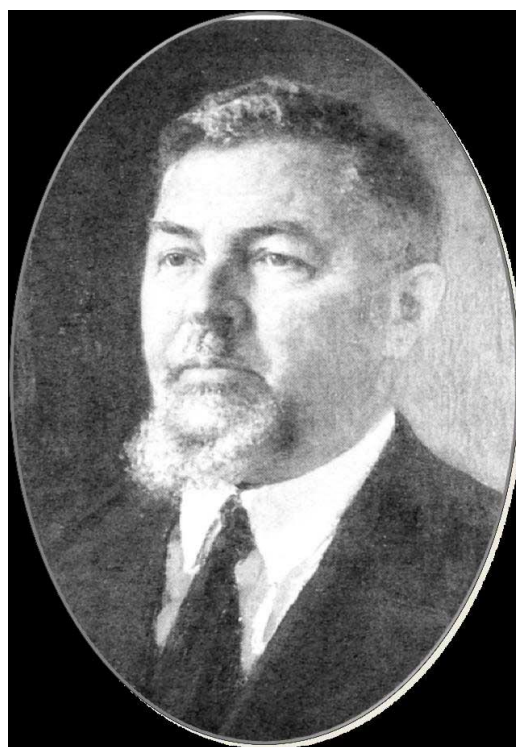
Рис. 2. А. З. Гринберг (портрет) 3 / Fig. 2. A. Z. Grinberg (portrait) 3

СССР» с обзорами и статьями о проектировании и строительстве в СССР и за рубежом. Территориально охват его деятельности масштабен, здания по его проектам были построены в разных городах: Москве, Нижнем Новгороде, Брянске, Ростове-на-Дону, Туле, Новосибирске, Саратове, Перми и др.