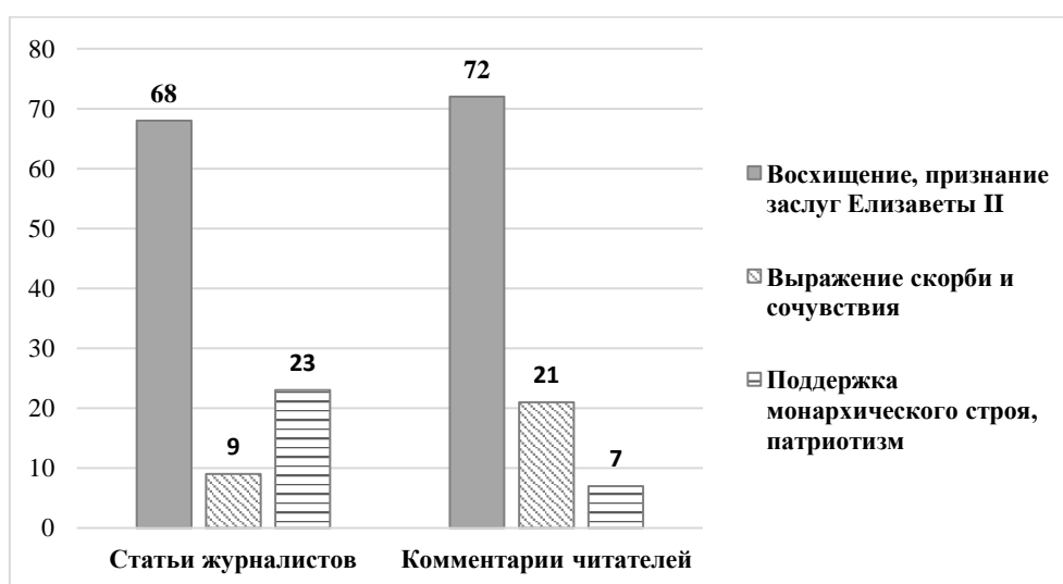
Рис. 1. Выражение положительной оценки в статьях и комментариях, % / Fig. 1. Expressing positive feedback in articles and comments, %

Позитивная тональность связана с выражением положительной оценки в рамках следующих тематических направлений ( далее ТН ): 1) восхищение личностью Елизаветы II, признание заслуг королевы; 2) выражение скорби в связи с утратой королевы, сочувствия родным; 3) высказывания в поддержку монархического строя Великобритании, выражение патриотических чувств. Выявлено, что как журналисты, так и читатели в большинстве случаев (68 % и 72 % соответственно) выражают положительную оценку в отношении личности Елизаветы II, высоко ценят ее заслуги и личные качества. Выражение скорби и сочувствия в большей степени характерно для комментариев читателей (21 %), чем для журналистов (9 %). Обратную картину наблюдаем в отношении третьего ТН, которое востребовано скорее в журналистском медиатексте (23 %), нежели в читательском (7 %) (рис. 1).