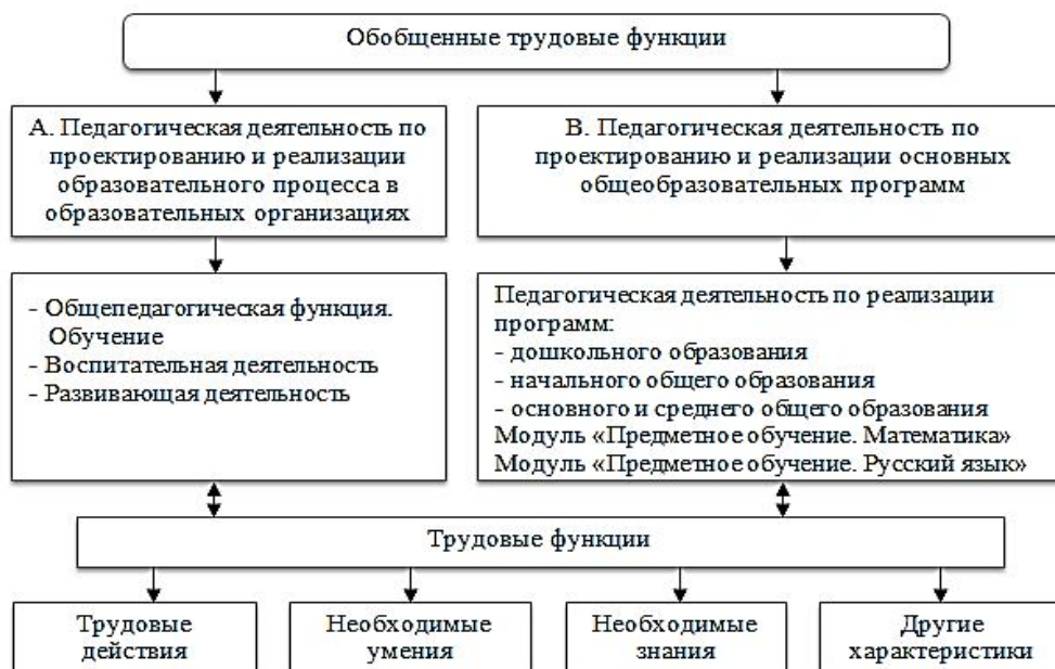
Рис. 1. Функциональная структура профессионального стандарта педагога / Fig. 1. Functional structure of the Professional Standard for teachers

Дается характеристика обобщенных трудовых функций (рис. 1).